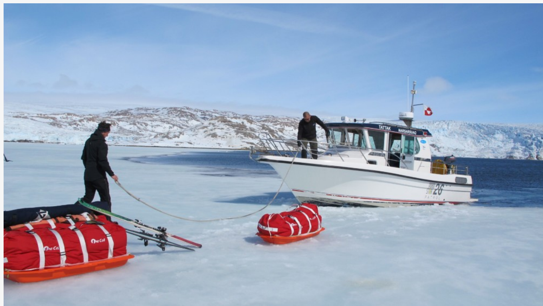
OPPLEVDE ORKAN: Kristiansen og Stavrum opplevde alt fra blå himmel og sol til orkan og 40 minusgrader på turen.